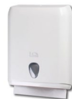
A59201S 375 x 137 x 280