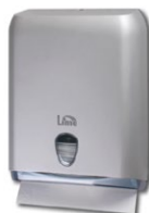
A59211SATS 375 x 137 x 280