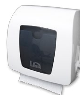
HF106 310 x 200 x 310

* Количество листов в рулоне указано для диспенсеров Lime Matic HF108 и HF106.