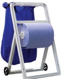
A56601 Напольный пластиковый