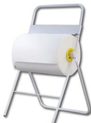
A52101 Напольный металлический