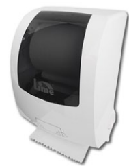
HF108 410 x 260 x 320