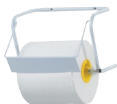
A52201 Настенный металлический