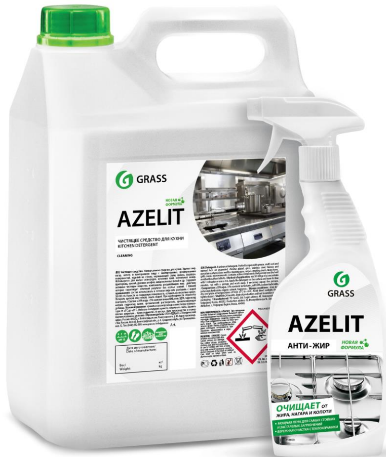
Azelit новая формула Количество основного вещества w=20