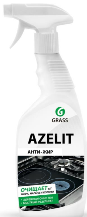
Azelit старая формула Количество основного вещества w=14